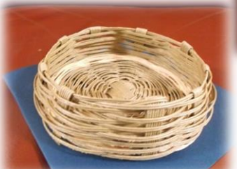
クラフトかご: 鮎ちゃん入れ