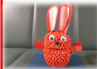
ブロック折り紙: うさぎ